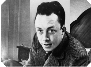
A. Camus® US Library of Congress