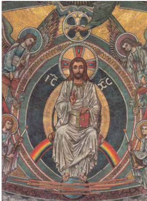
Jesus Christus als Pantocrator: Mosaik in der Apsis des Bonner Münsters. Ansichtspostkarte

„Ich kann Euch aber sonst nicht viel Wissenswertes erzählen, weil ich fast den ganzen Tag (ausgenommen zu den Mahlzeiten und während der Unterrichtsstunden ...) in der