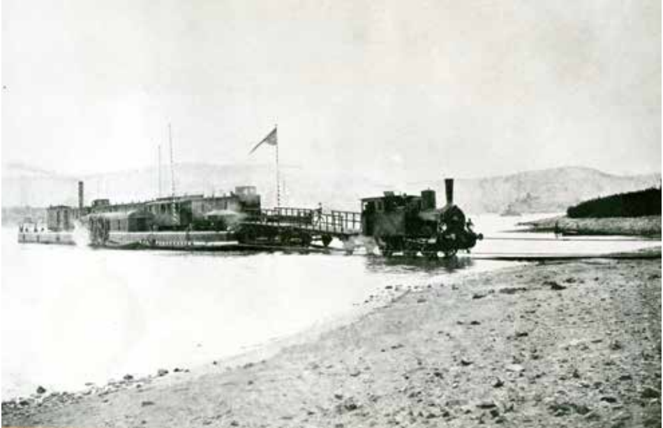
Eisenbahntrajekt am Bonner Rheinufer. Unbekannte Fotografie, um 1900 (Stadtarchiv Bonn, Bildsammlung)

Das Deutschlandbild hat jedoch mehrere Gesichter und nach Kurt Ringer lassen sich bei Pirandello mindestens drei unterscheiden: das gelebte Deutschland, das poetische Deutschland, das in seinen Gedichten besungen wird, und das politisierte oder ideologische Deutschland, das nach dem Ersten Weltkrieg die Erzählungen Pirandellos bestimmt. 48 Obwohl aus den Briefen generell ein positives Deutschlandbild strahlt, findet Pirandello nicht immer schmeichelhafte Worte für die Deutschen: „Alle Deutschen sind gesellig, aber sie wählen ihre Bekanntschaften mit Bedacht.“ 49 Eine Konstruktion wie die Eisenbahnfähre, die Bonn mit Oberkassel verband, indem ein „vollständiger Zug mit Güter und Personenwagen ... einen Fluß mit Hilfe eines großen Schiffkörpers“ überquerte, erweckte Argwohn und leichten Spott: „Ich versichere, ich hätte mir nie träumen lassen, so etwas mit eigenen Augen zu sehen. Scheint Euch das nicht auch großspurig wie in Amerika zu sein? Und doch sind wir in Deutschland, in einem Land, in dem man sogar die Scherze mit Ernst macht.“ 50 Neben den Karnevalsverkleidungen fallen ihm auch noch weitere Maskierungstendenzen in der deutschen Kultur auf: „Dies ist das Land des Militarismus und der Uniformen.“ 51