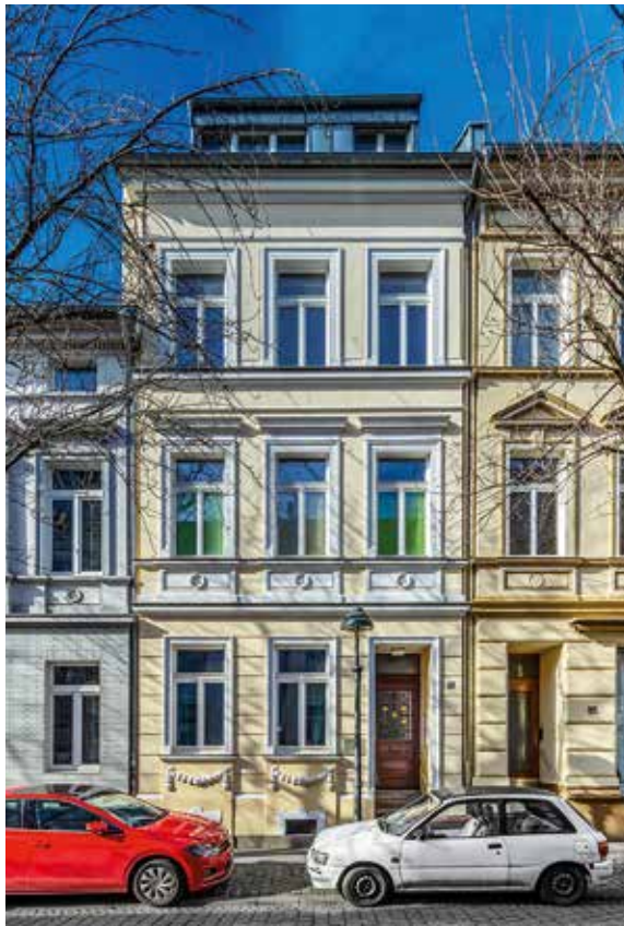
Haus Breits Straße 83, seinerzeit 37a. Foto: Klaus Pawlak, 2019 (Stadtarchiv Bonn, Bildsammlung)

Heute ist Pirandello in Bonn nach wie vor präsent. Bis vor einigen Jahren existierte in der Brüdergasse 22 ein italienisches Restaurant, das Pirandello hieß, 1986 wurde ihm in Ippendorf die Luigi-Pirandello-Straße gewidmet und in der Breite Straße 83, in der sich sein letzter Wohnsitz im Haus der Familie Lander befand, das damals noch die Hausnummer 37a hatte, finden wir eine Tafel, die 2012 im Rahmen des Wettbewerbs