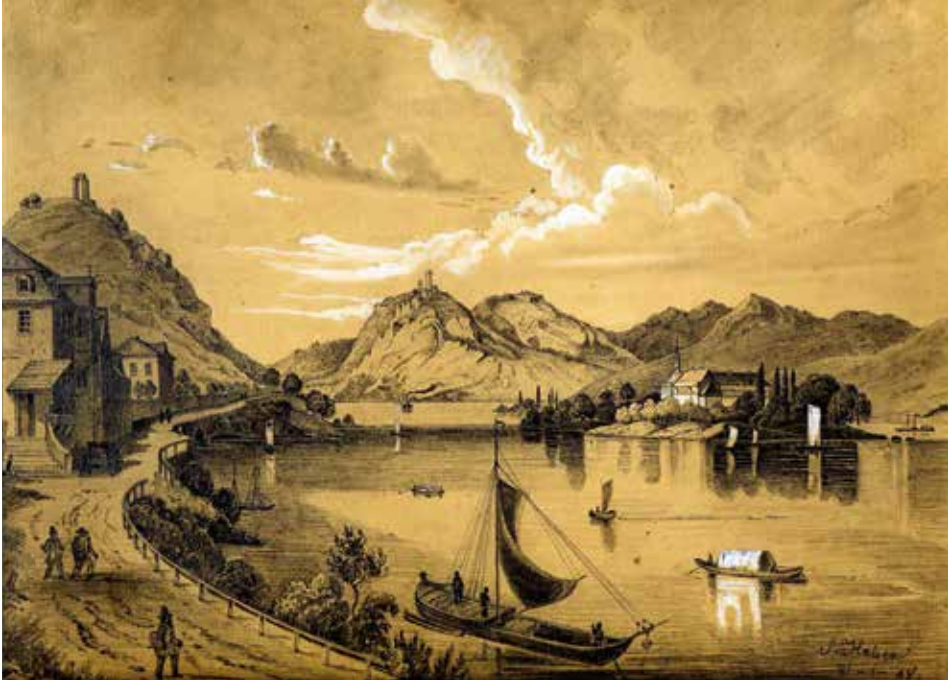
Der romantische Rhein mit Rolandsbogen, Insel Nonnenwerth und Drachenfels. Lithographie von Johannes Ruff, um 1850

guten Weines 9 . Darüber, ob er den italienischen Tropfen auch hat genießen können, lässt sich nur spekulieren, mag der Wein, der im sonnigen Italien vortrefflich gemundet hat, in Deutschland – unter einer Wolkendecke – einen ganz anderen Geschmack entwickelt haben. Das Wetter im Rheinland bietet Pirandello tatsächlich einen häufigen Anlass zu Klagen; nicht nur kostet ihn der ungewohnte Gang auf Schnee einen verstauchten Fuß, er scheint regelrecht in eine Winterdepression getrieben zu werden. Das winterliche Bonn nimmt Pirandello wahr wie „eine kleine Ansammlung grauer Häuschen mit schwarzen Dächern wie in Trauerkleidern aufgrund der ewigen Abwesenheit der Sonne“ 10 , er klagt über Kälte, Regen, Nebel und „ewige Wolken“ 11 : „Der Himmel ist so trist hier, so finster, die Tage ziehen vorbei, so bewölkt und ohne ein Lächeln der Sonne...“ 12 . „Ich will die Sonne, ich will das Licht, und hier sieht man weder die eine, noch das andere; wie pausenlose Sonnenuntergänge erlöschen sich hier die Tage.“ 13 Zwar übt das rheinische Klima auf die heitere Seele des jungen und sensiblen Sizilianers einen eher düsteren Einfluss aus, der Region rund um die Stadt und dem Rhein „an sich“, dem „heroischen, traurigen Fluss“ 14 , Rolandseck oder Drachenfels sowie den „überaus lieblichen Gegenden am Rhein“, die „von unzähligen