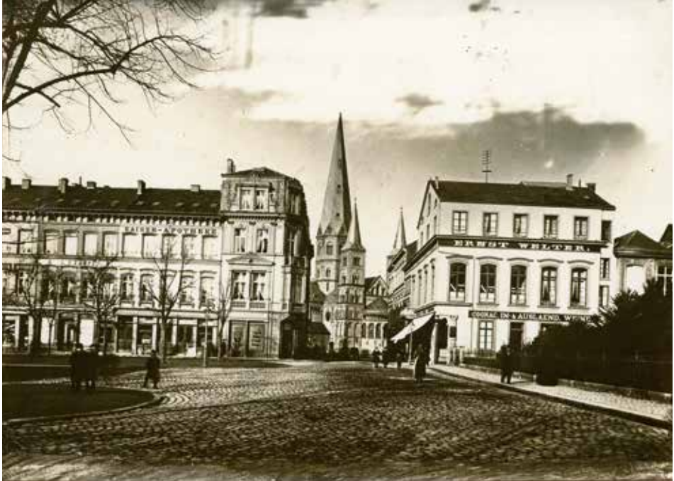
Straße Am Neutor. Links die Nr. 1. Unbekannte Fotografie, um 1900 (Stadtarchiv Bonn, Bildsammlung)

bei er in einem Brief an die Eltern seine Aussicht aus dem Fenster zu beschönigen scheint, wenn er schreibt, dass er zugleich einen Blick auf den Rhein, die Berge, die Stadt und das Land genießen könne 6 – lebt er für einige Wochen mit Vollpension im Hotel Zum Münster, das am Münsterplatz lag, heute aber nicht mehr existiert. Pirandello lobt die schweren Mahlzeiten, die ihm dort serviert werden: „Die deutsche Küche ist sehr gut, ganz nach meinem Geschmack – ich esse wie ein Wolf“ 7 , heißt es in einem Brief an die Eltern, und um ihnen zu versichern, dass er sich in guten Händen befindet, beschreibt Pirandello präzise seine Essgewohnheiten: