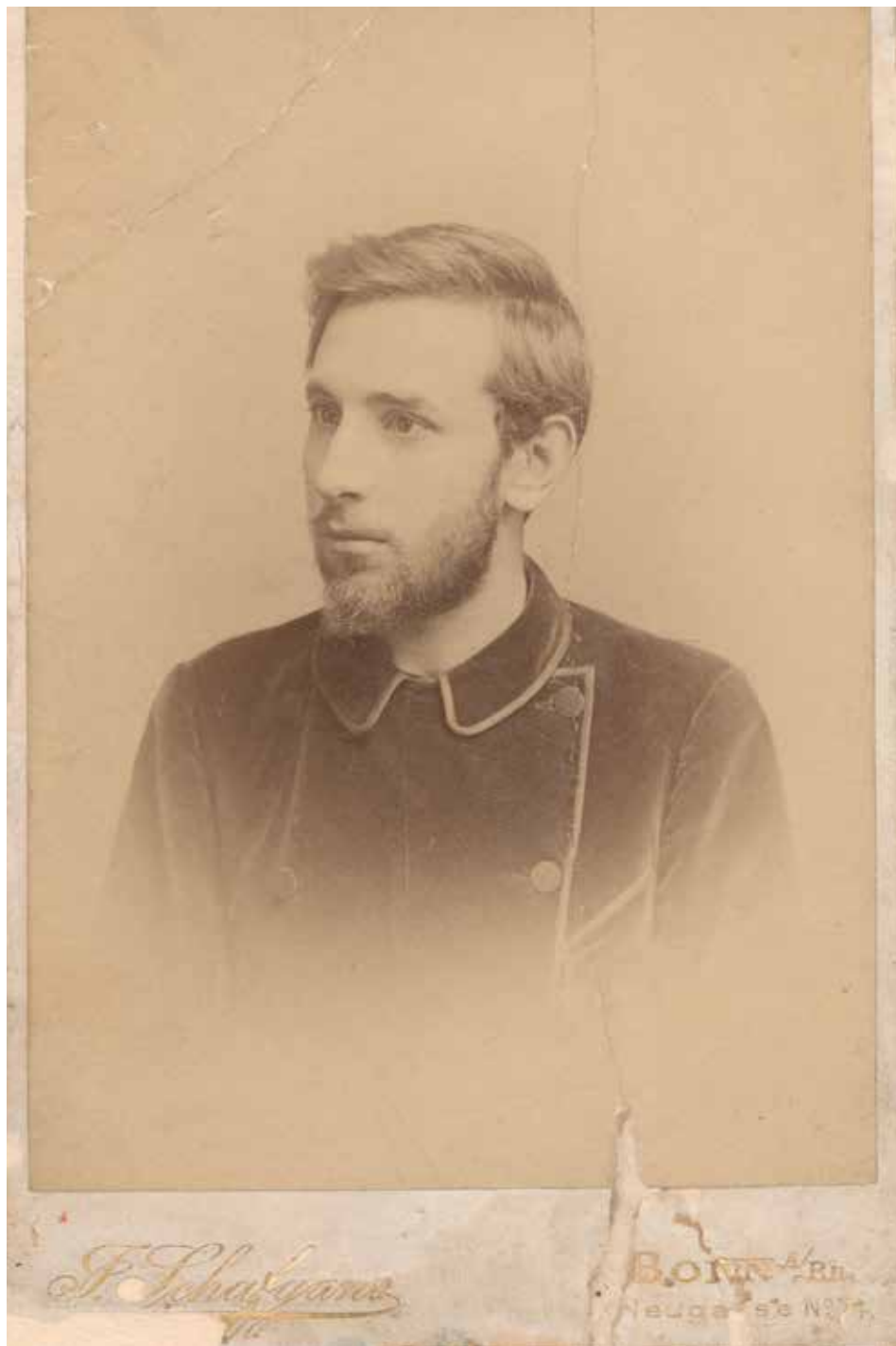
Luigi Pirandello (1867-1936).